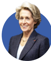
Caroline Cayeux Présidente de l'ANCT